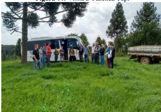
Figura 04: Visita à Fazenda Tupi

Ressalta-se que as palestras (18%) foram ministradas por diferentes técnicos da área ambiental que atuam no município. A Figura 04 apresenta uma das visitas realizadas a Fazenda Tupi por uma instituição de ensino superior.