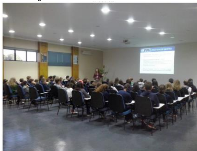
Figura 04: Palestra como atividade interna

As visitas guiadas foram realizadas por 137 alunos e professores onde os mesmos conheceram a estação de tratamento de efluentes e o arboreto, onde encontra-se a mata nativa. Outra atividade interna realizada foi a Semana Interna da Empresa, organizada com o objetivo de para interagir com os 03 turnos que a mesma funciona. Ao todo 80 colaboradores aderiram as atividades oferecidas, que foram: palestras, visita guiada e plantio de mudas. A Figura 5 mostra uma colaboradora fazendo o plantio de uma araucária no arboreto.