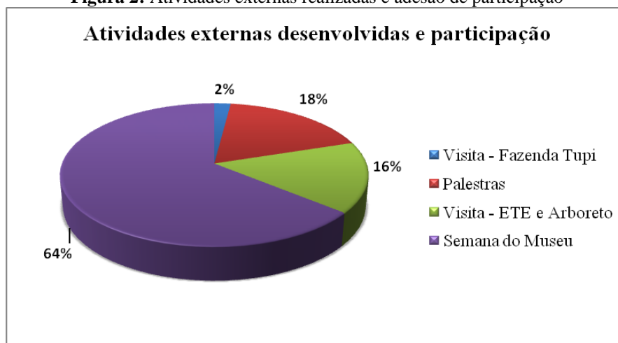
Figura 2: Atividades externas realizadas e adesão de participação

Conforme observado na Figura 2, percebe-se que a maior participação, com 62,58% ou seja, 450 pessoas, foi da integração conjunta com a Semana do Museu. Neste evento foi exposto o gerenciamento de resíduos da empresa bem como a demanda de água e perdas relacionadas.